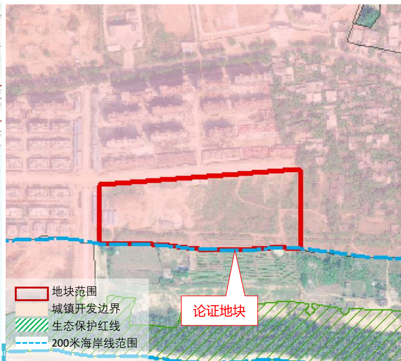
市域国土空间总体规划图