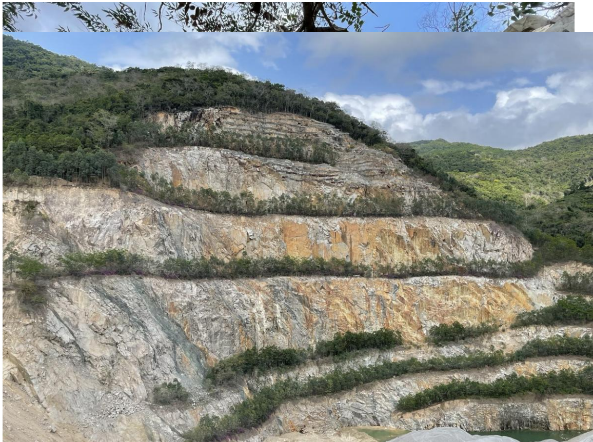
图6 矿坑采面岩石破碎，存在掉块风险