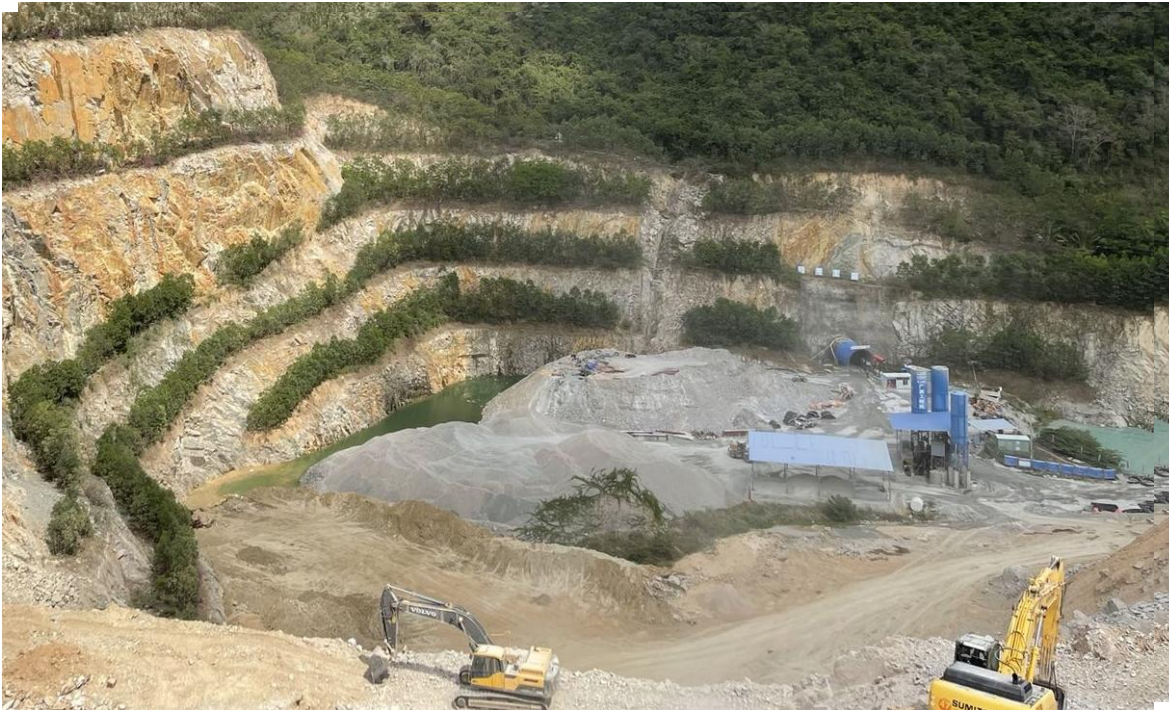
图 4 采坑底板平台预留水塘，西水中调工程使用场地