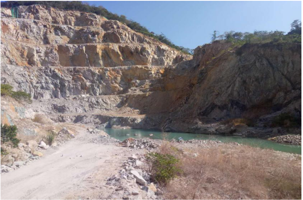
图 1 治理前矿山地质环境现状