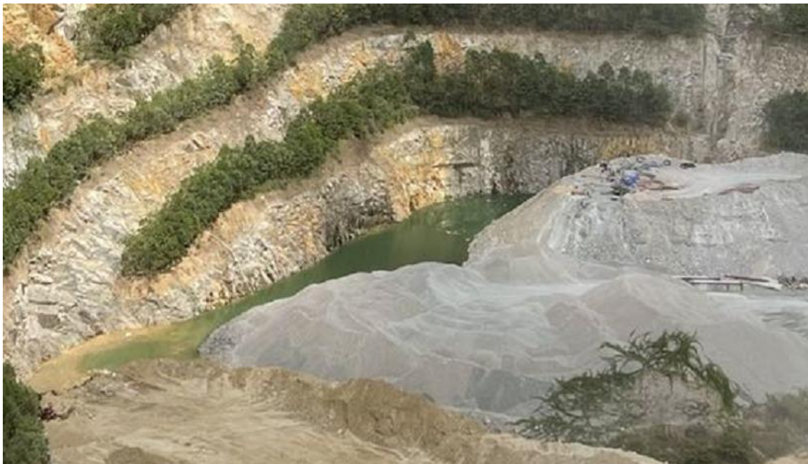
图 8 采坑底板积水塘周边无安全防护