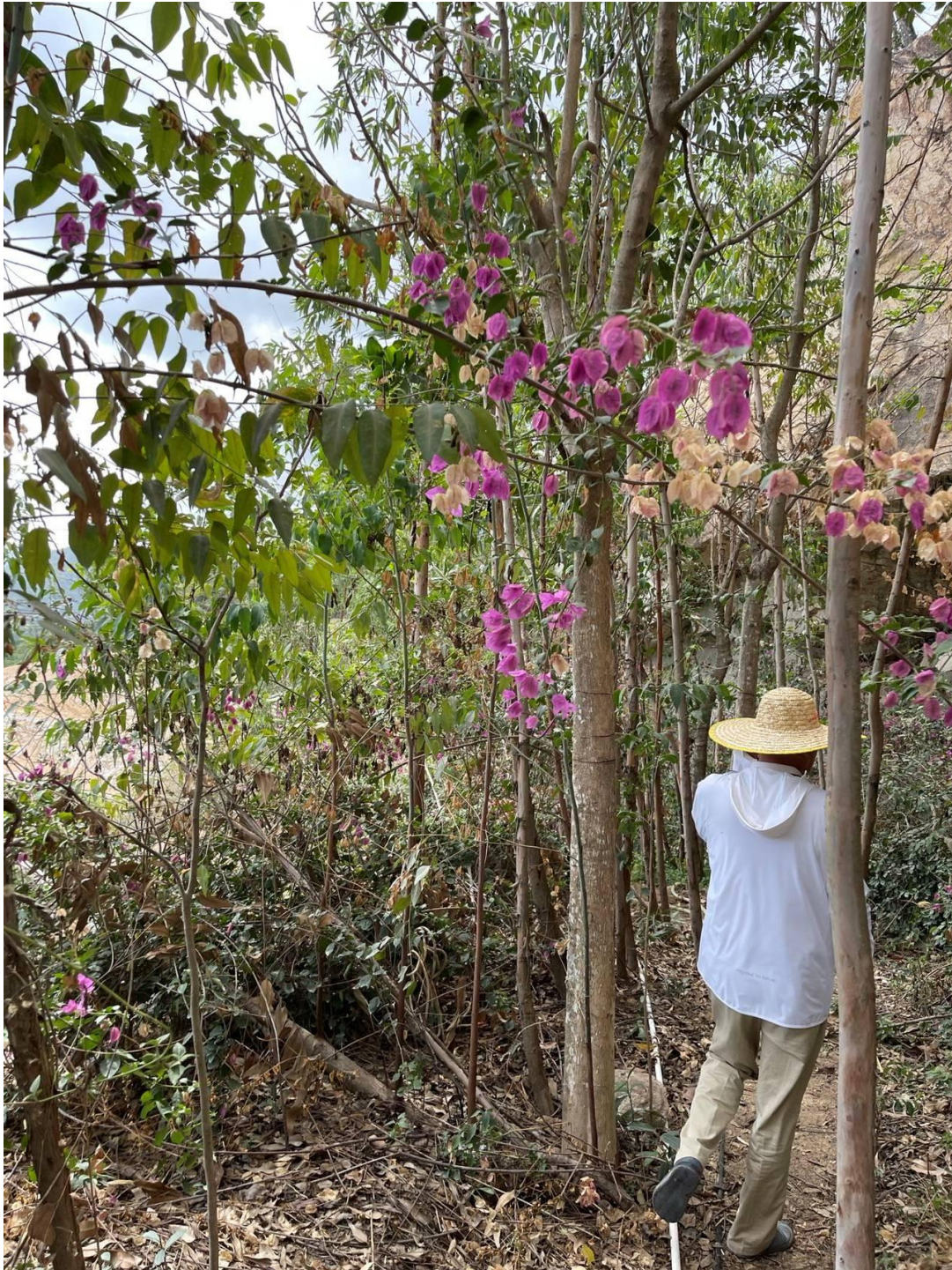
图5 采坑边坡台阶平台植树实景图（近距离拍摄）