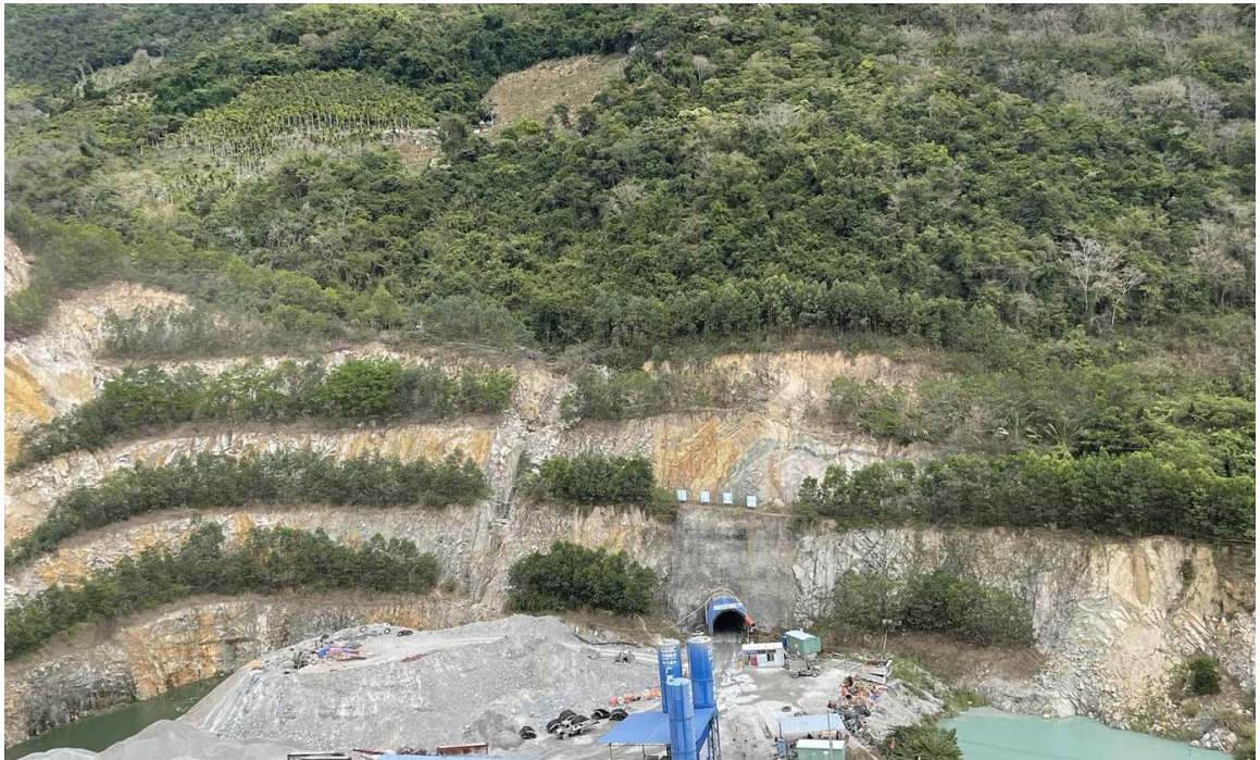
图 2 采坑东侧边坡台阶修整及复绿