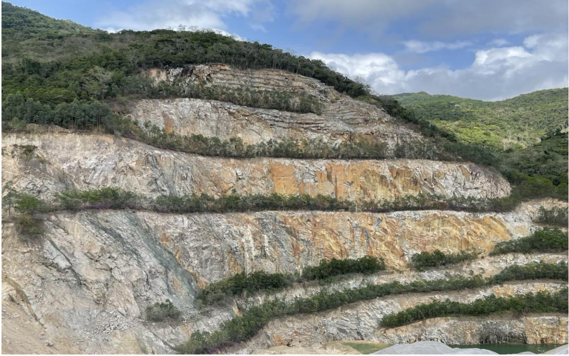
图 3 采坑北侧边坡台阶平台植树复绿