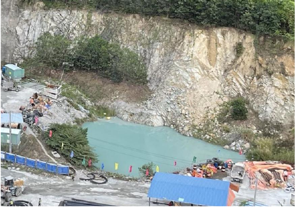
图9 采坑底板积水塘周边安全防护设施缺失