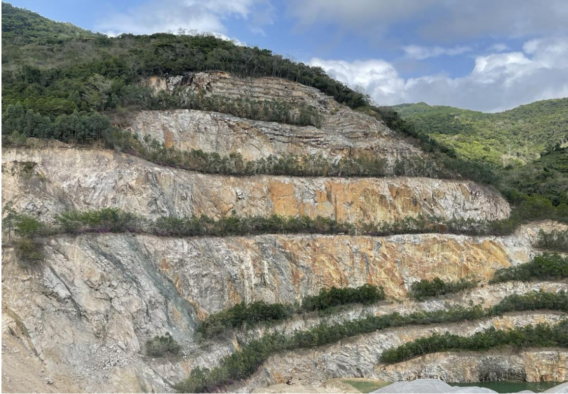
图 7 北侧边坡坡面高陡，部分坡面无法复绿