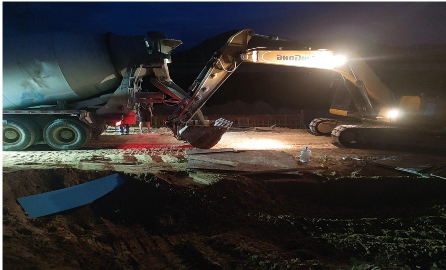
挡土墙墙身砼浇筑