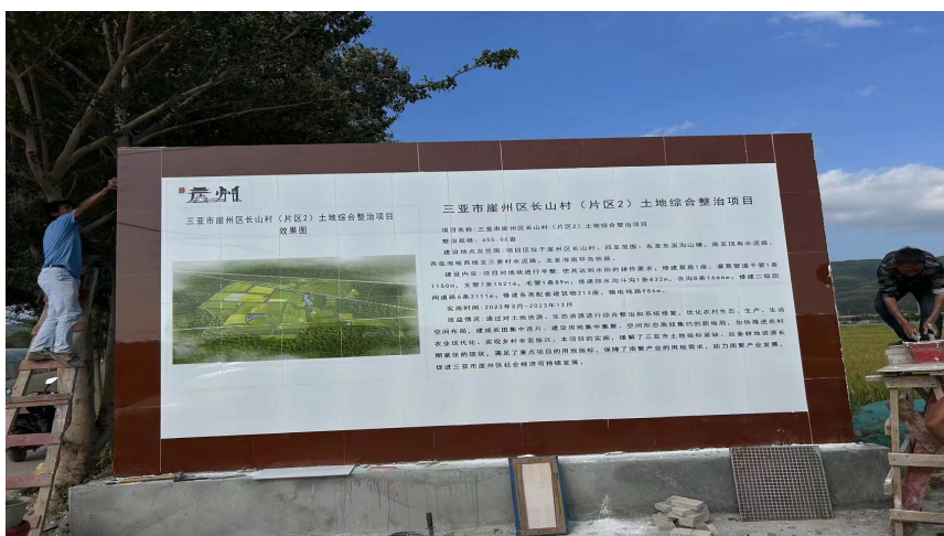
项目公示牌实施后