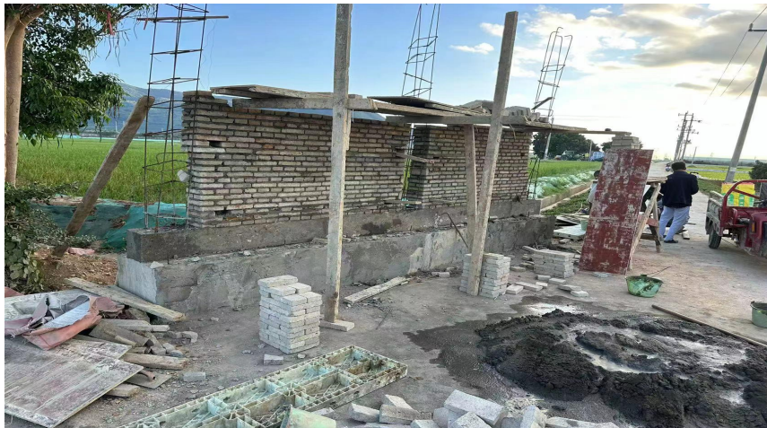
项目公示牌实施中