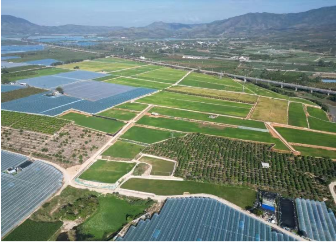
项目实施后种植水稻航拍图