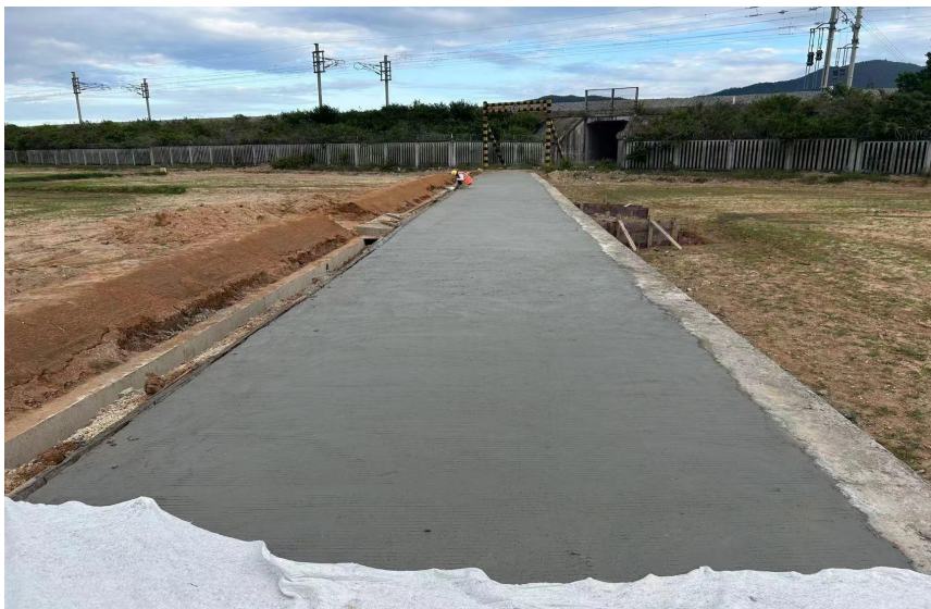
二级田间道路路面砼浇筑