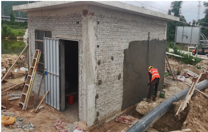
泵房墙身砌筑及砂浆抹面