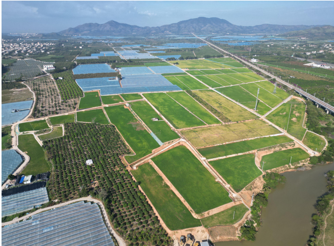
项目实施后种植水稻航拍图