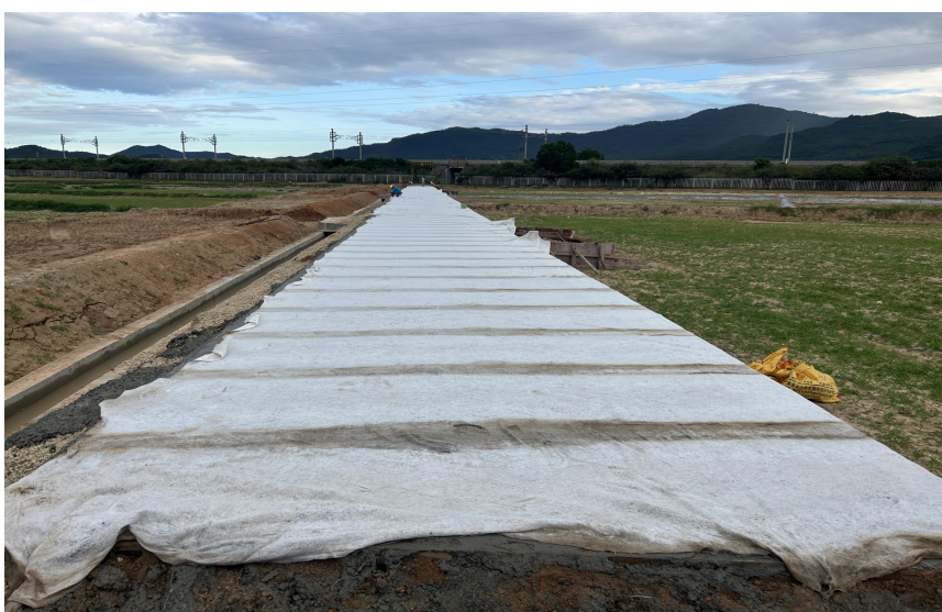
二级田间道路路面覆盖土工布洒水养护