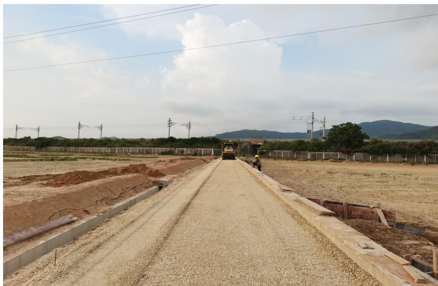
二级田间道路级配碎石层压实