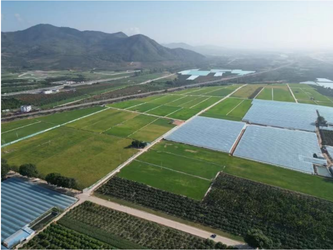
项目实施后种植水稻航拍图