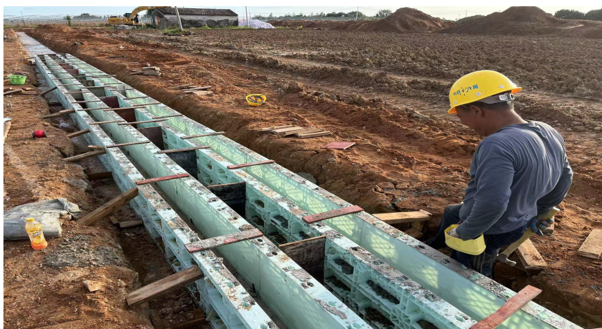
农沟墙身模板安装