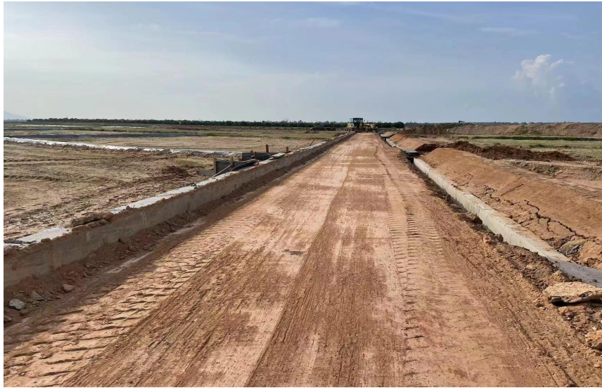
二级田间道路路基整平压实