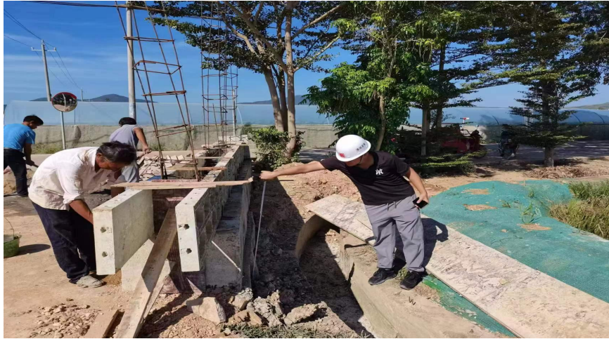
项目公示牌实施中