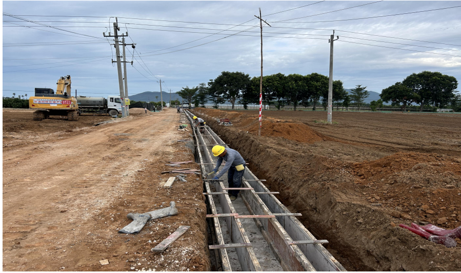
斗沟墙身模板安装