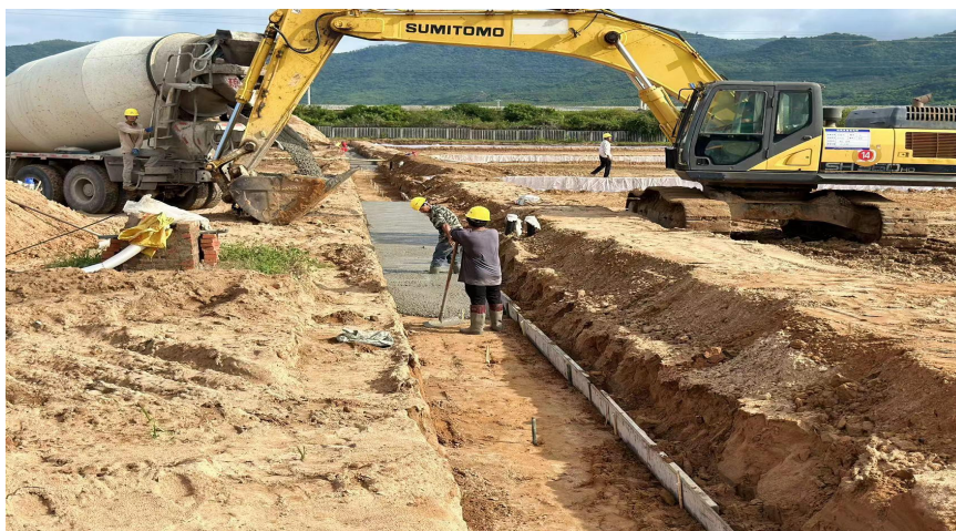
农沟沟槽开挖、垫层底板砼浇筑