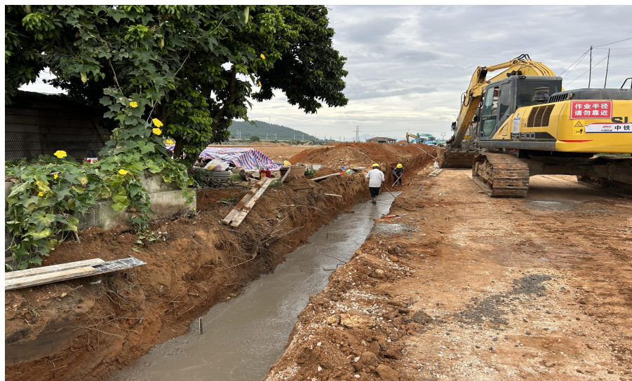
斗沟垫层、底板浇筑