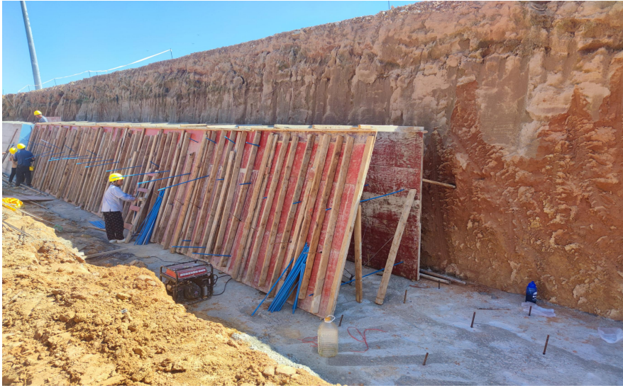
挡土墙基础浇筑及墙身模板安装