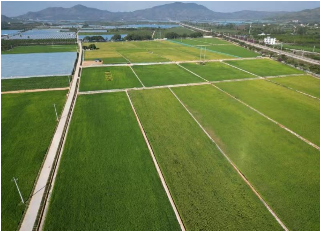
项目实施后种植水稻航拍图