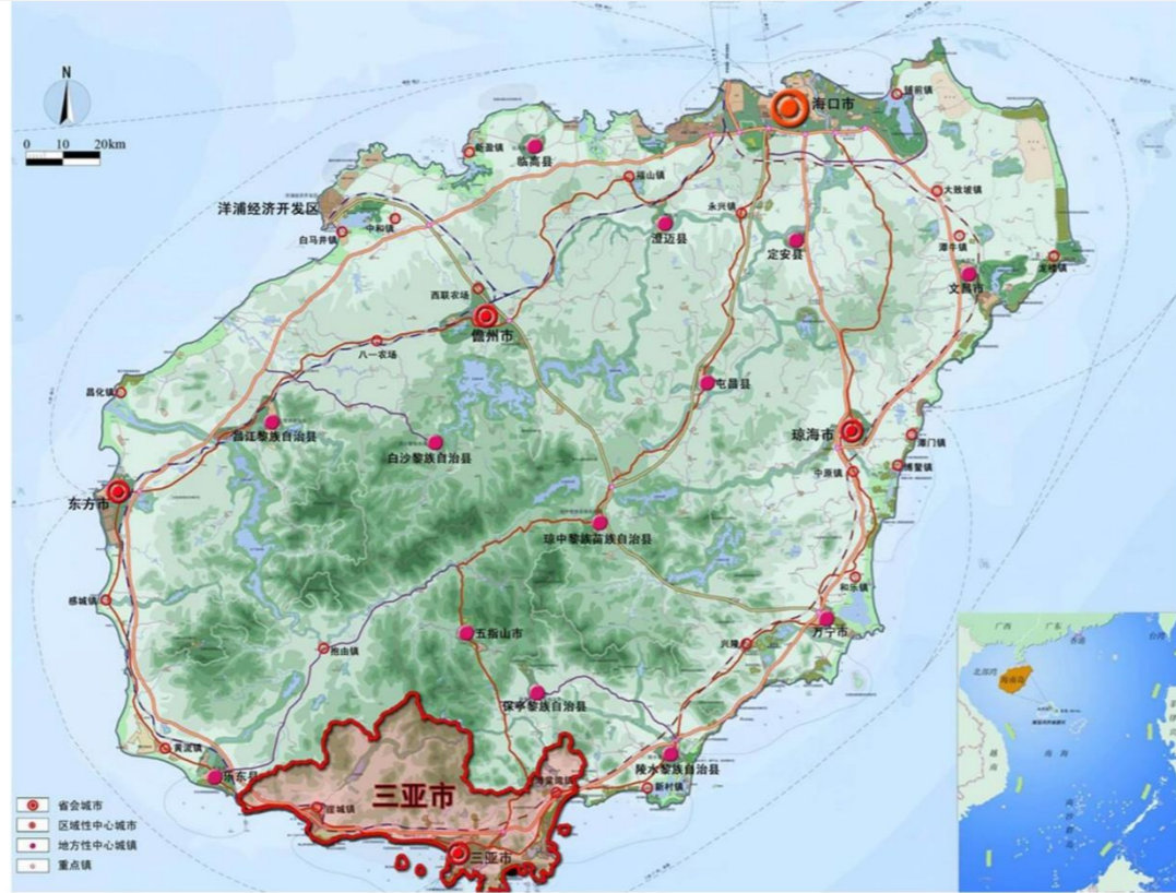
▲ 三亚在海南省的位置

拟调整用地位于保利C + 博览中心西侧，用地呈L型，西、南两侧均临主干路，交通便利。西侧临林旺路，南侧临江林路。总用地面积126亩。