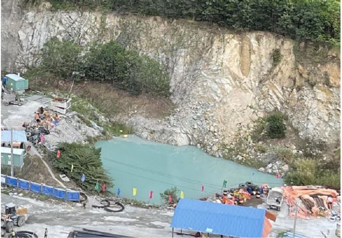
图9 采坑底板积水塘周边安全防护设施缺失