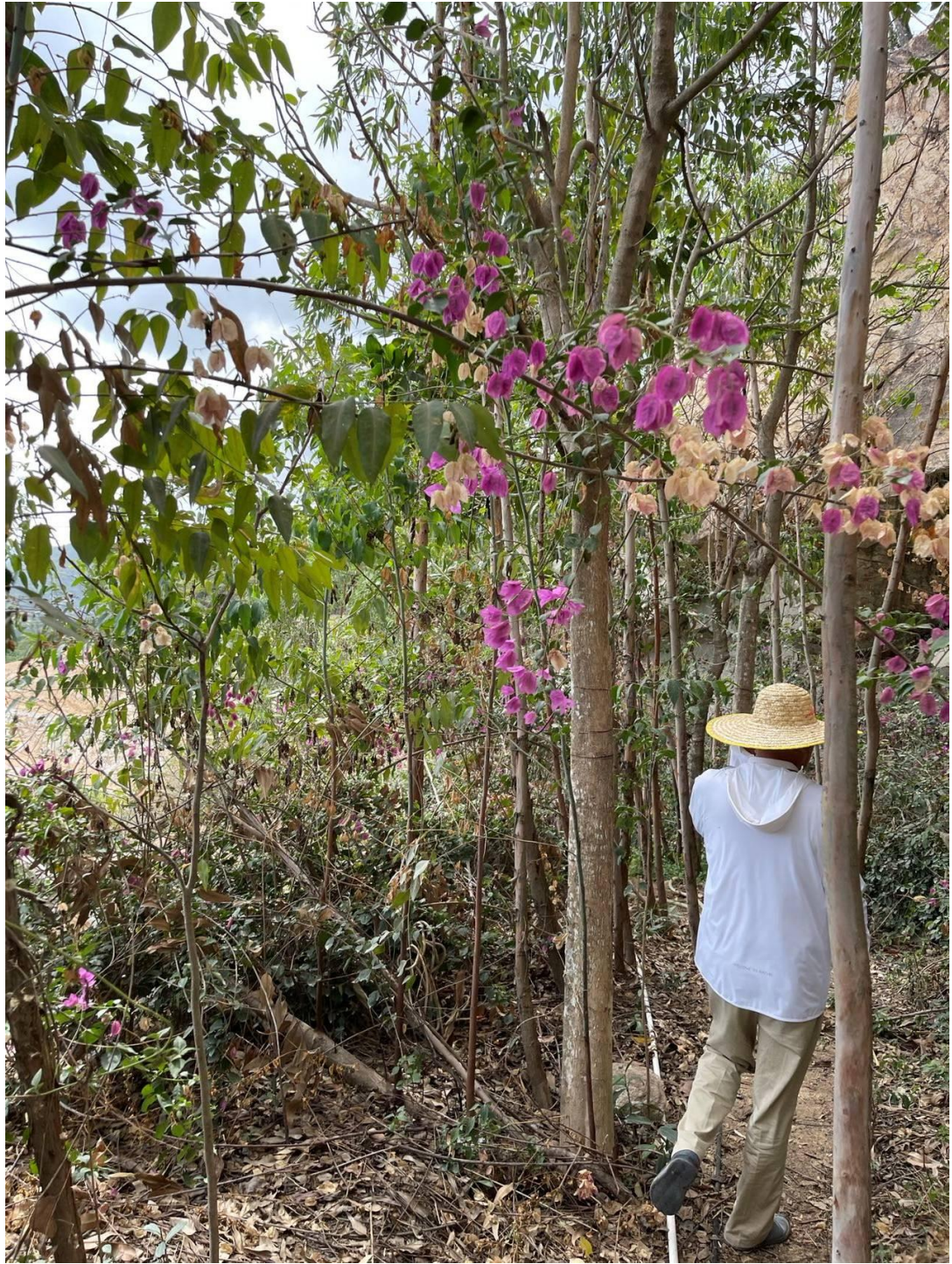
图5 采坑边坡台阶平台植树实景图（近距离拍摄）